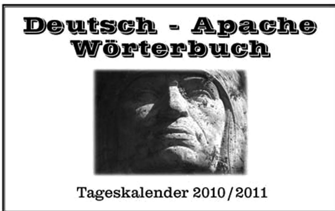
Photo: Apache-Deutsch-Wörterbuch für drei Gefängnisse (Apache-German Dictionary for Three Prisons), Intervention, Chemnitz, Zwickau, Waldheim, 2010