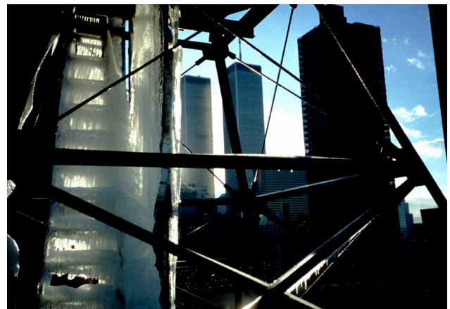
Photos: Links/left: Die Reise nach Kaho'olawe/The trip to Kaho'olawe , Intervention, Hawaii, 2018 Rechts/right: New Yorker Eisleiter/New York Ice Ladder , Intervention, Manhattan, 2001