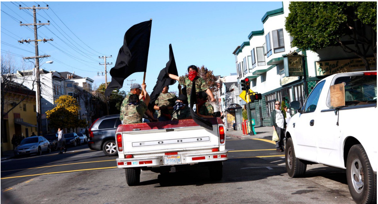
Photo: Hans Hs Winkler, Buy a Revolution , Intervention, San Francisco, 2010